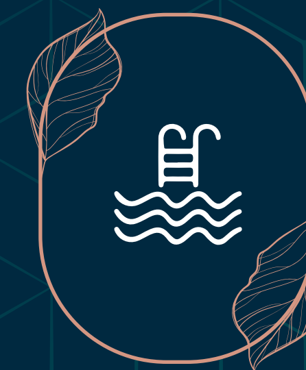
Kolam Renang Bersaiz Olimpik (50m)