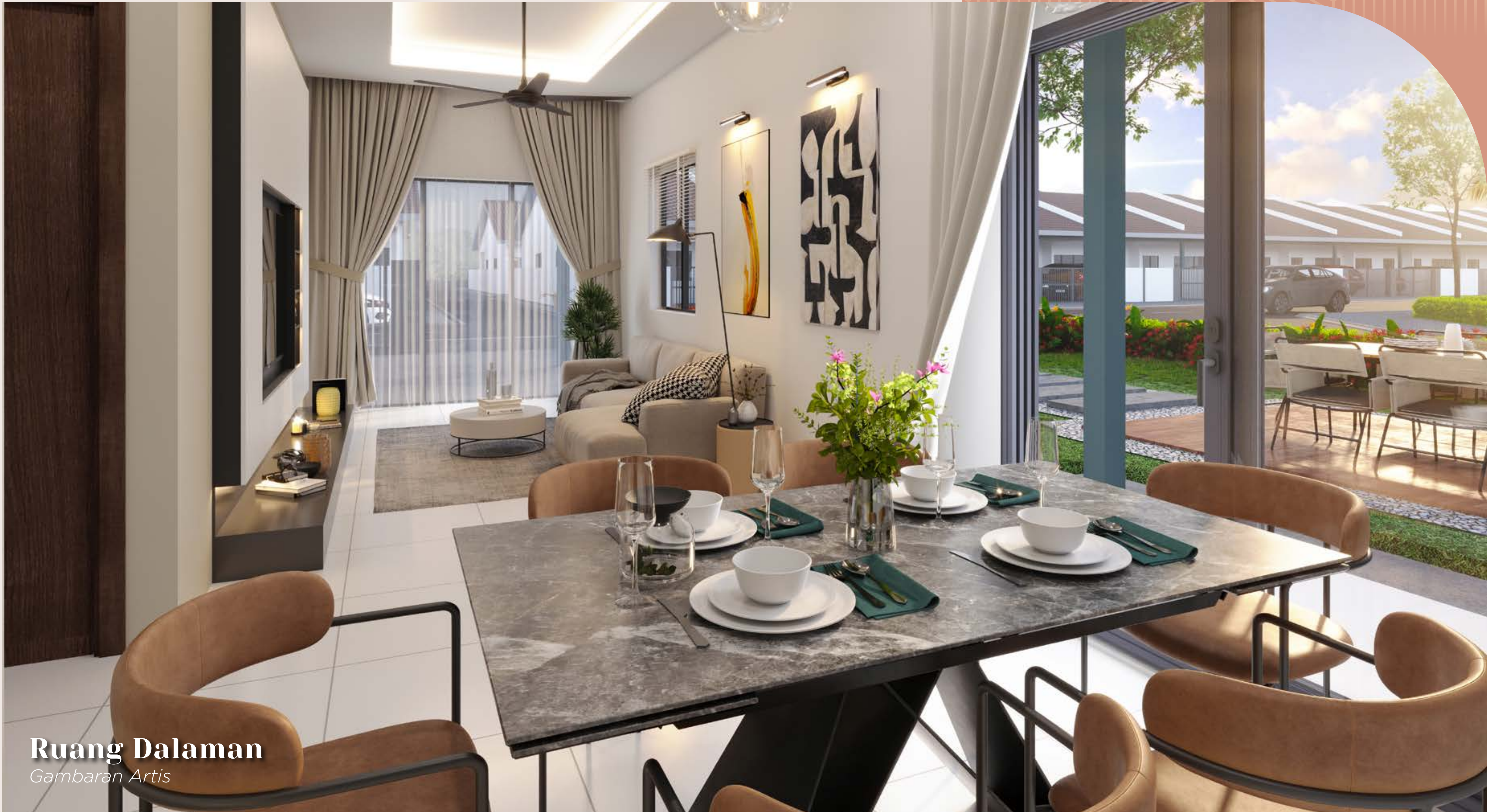
Ruang Dalam Gambaran Artis